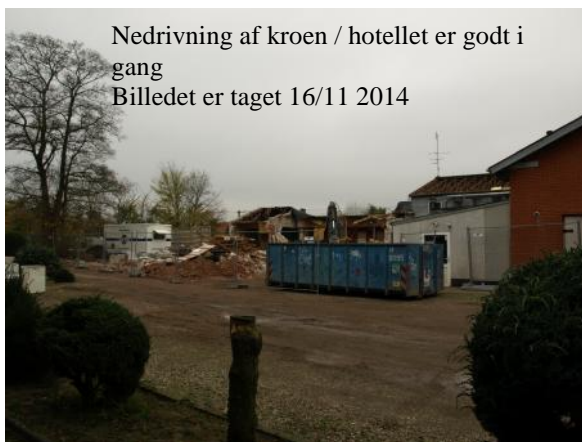
Nedrivning af kroen / hotellet er godt i gang Billedet er taget 16/11 2014

I kan melde jer ind ved at indbetale beløbet på reg.nr. 5362 konto nr. 0667737 og oplyse navn og adresse ved indbetalingen.