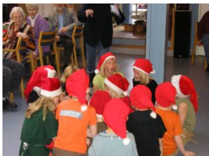
Billeder fra fredsllys 2008

Så er vi godt på vej ind i vinter sæsonen og julen nærmer sig, vi starter her d.23 og 24 november, med julebasar, et par dage hvor centeret bliver fyldt med glade folk i julestemning ,der spilles i tombola, købes juleting og ikke mindst juledekorationer, de slutter som reglen af med Æbleskiver og Gløgg.