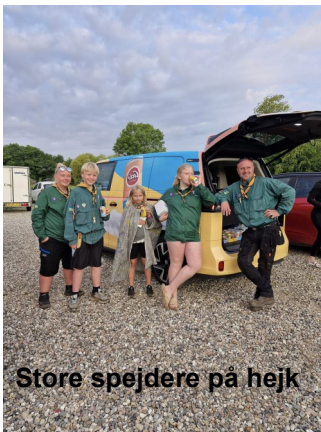
Store spejdere på hejk

Tirsdag eftermiddag da vi var kommet godt hjem fra hejken, sluttede vores yngste spejdere sig til os. Den udmattende vandretur sluttede med helstegt pattegris til alle til aftensmaden.