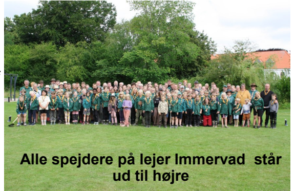
Alle spejdere på lejer Immervad står ud til højre

Vi skulle overnatte i bivuak og næste dag gik turen tilbage til Hoptrup. Spejderne holdt humøret højt, selvom turen var på ca. 35 km i alt. Vores to drengespejdere var de første, der nåede retur til Hoptrup. Det var virkelig sejt gået.