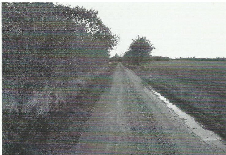
Skausvej i Over Jerstal set mod nord. Puklen på vejen et stykke fremme er hvor skinnerne fra den gamle Amtsbane gik over.

I 1354, da jernbanen blev anlagt, kommer gården til at ligge vest for jernbanen, mens den største del af jorden lå øst for banen. Det gav store problemer, når man skulle forcere skinnerne med redskaber og heste. Derfor flyttede man i 1868 gården ud øst for bane. For at komme til og fra gården måtte der anlægges en vej ned til byen, den blev naturligvis kaldt Skaus Vej. Vejen var en privatvej indtil 1938, da den blev til en kommunevej med navnet Bakkevej.